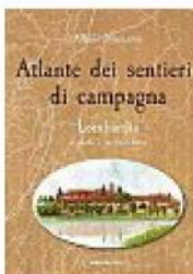
Albano Marcarini, Atlante dei sentieri di campagna. Lombardia a piedi e in bicicletta , Ediciclo, 156 pagine, 19,90 €

Nasce una nuova collana dedicata ai sentieri vicino alle metropoli. Il primo volume contiene 33 proposte nella campagna lombarda, dall'Adda di Leonardo ai boschi del Ticino, dalle limonaie del Garda alle marcite milanesi. Il libro è corredato da acquerelli e da indirizzi per trovare prodotti a chilometro zero e assaggiare le specialità locali nelle trattorie lungo i tragitti indicati.