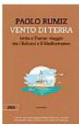
Paolo Rumiz, Vento di terra. Istria e Fiume: viaggio tra i Balcani e il Mediterraneo , Bottega Errante, 127 pagine, 14 €

A 26 anni dalla prima uscita, torna un'opera di uno dei viaggiatori più profondi e consapevoli del nostro tempo, Paolo Rumiz. È un reportage nell'Istria subito dopo il conflitto nell'ex Jugoslavia. Da rileggere, o leggere, per capire, di questa terra, "il suo millenario mimetismo. Il suo non essere di nessuno. Né italiana, né slovena, né croata. Il suo essere "nostra"... Terra di coloro che la adottano, la abitano, la coltivano, la vivono". Un libro toccante.