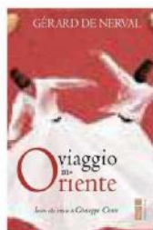
Gérard de Nerval, Viaggio in Oriente , edizioni Ares, 704 pagine, 24 €

Il poeta francese Gérard de Nerval (1808-1855) raccontò in un diario l'itinerario compiuto verso l'Oriente. Dall'uscita da Parigi all'arrivo in Grecia, dalla Turchia all'Egitto, il libro mescola realtà e mito, incontri e leggende, creando un immaginario di moschee, regine, emiri, magia. Le pagine dell'opera, nota nell'invito alla lettura Giuseppe Conte, sono "un flusso continuo, inarrestabile, di immagini, riflessioni, avventure, divagazioni, miti, storie sapienziali".